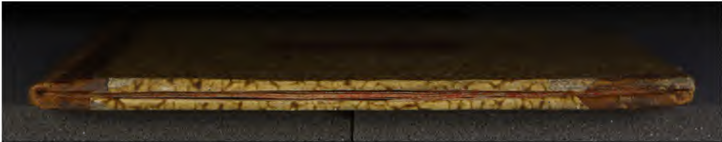
Early European Books, Copyright © 2009 ProQuest LLC. Images reproduced by courtesy of the Royal Library, Copenhagen. LN 1106 4°